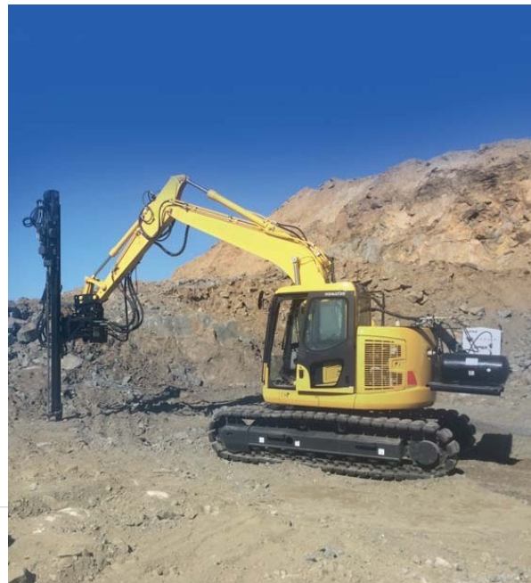
Trocador de Hastes – Martelo de Superfície (Opcional)